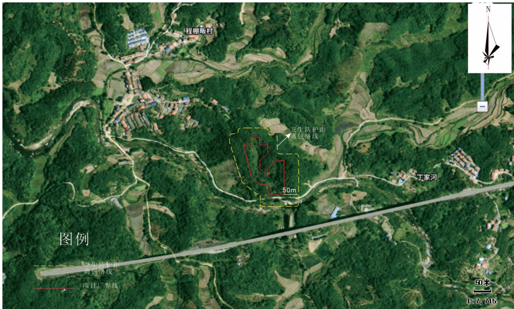
附图 5 项目卫生防护距离包络线图