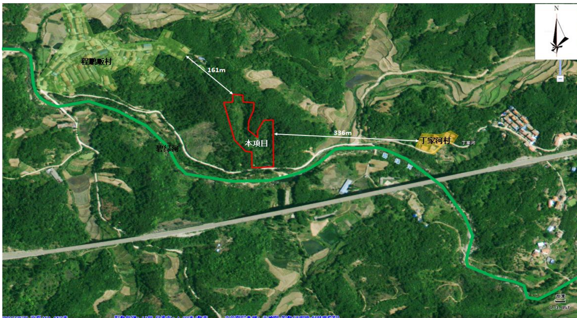
附图 2 项目周边环境关系示意图