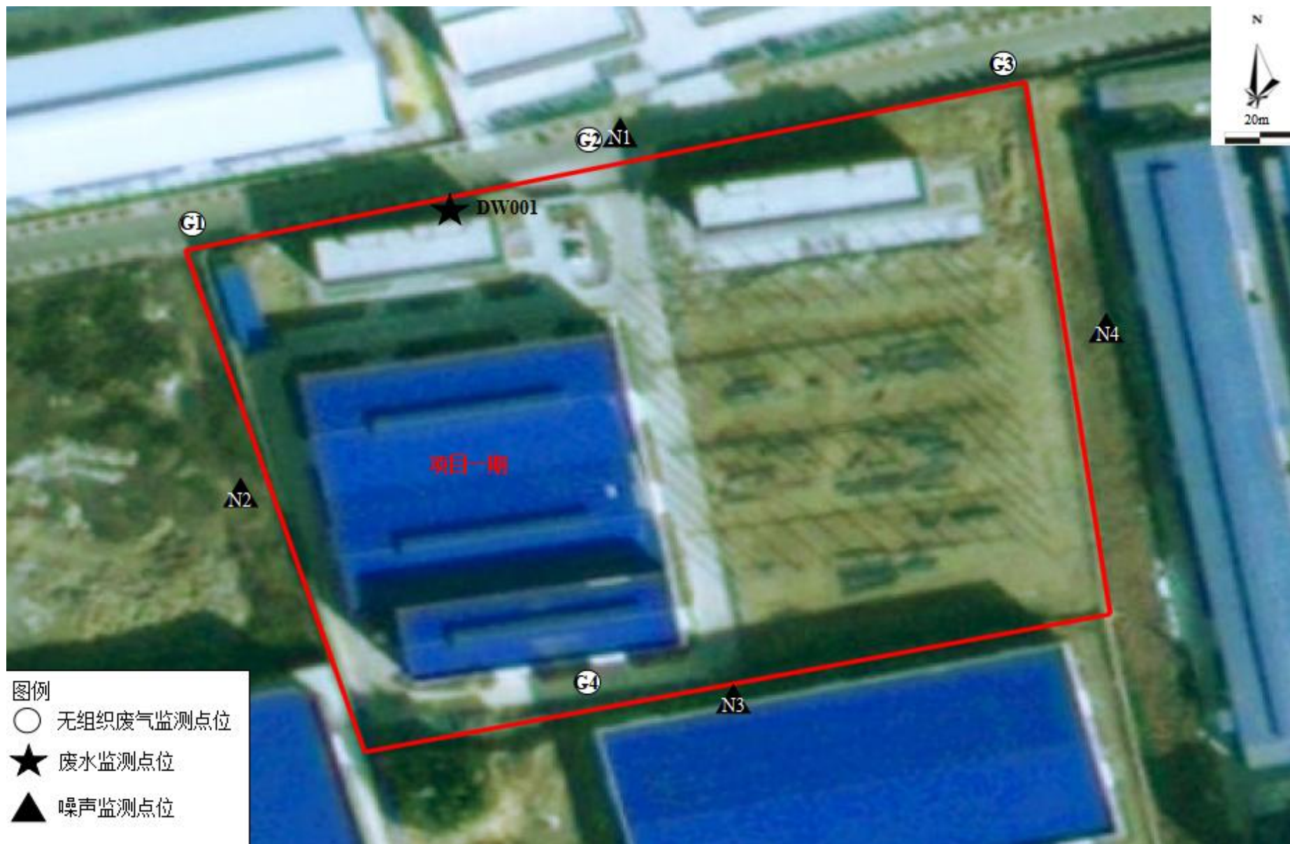
附图 4 项目验收监测点位图