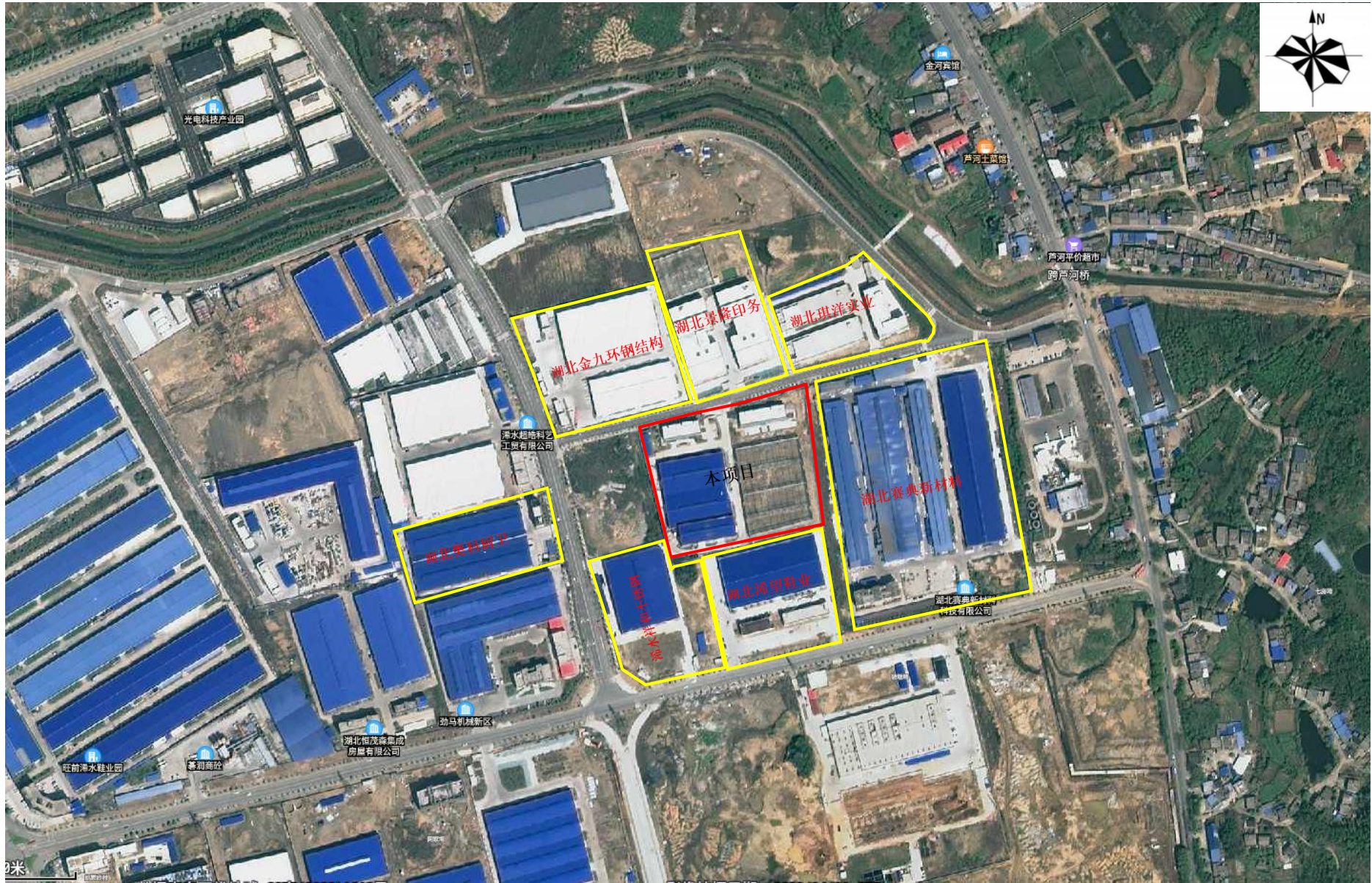
附图2 项目周边环境关系示意图