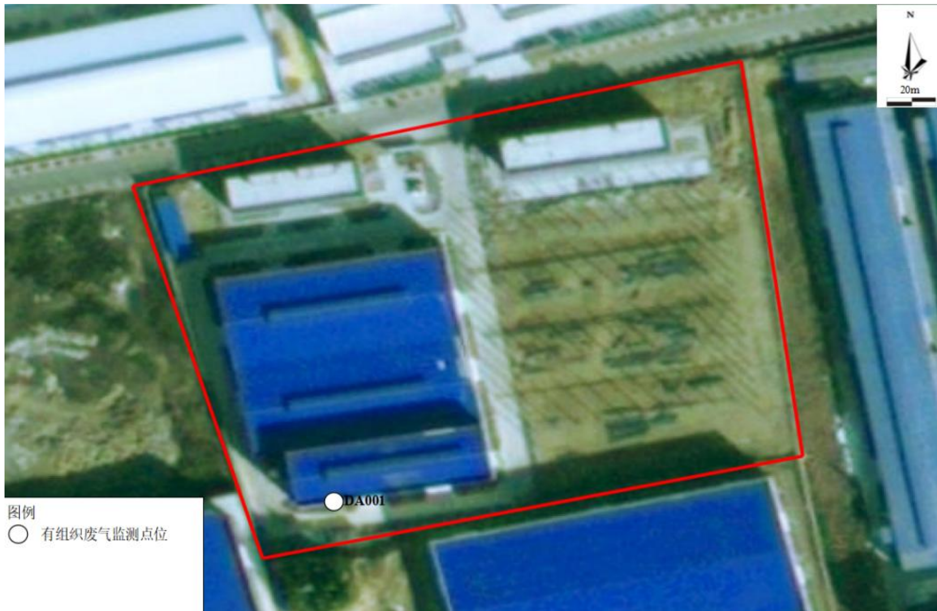
附图 4-1 项目有组织废气验收监测点位图