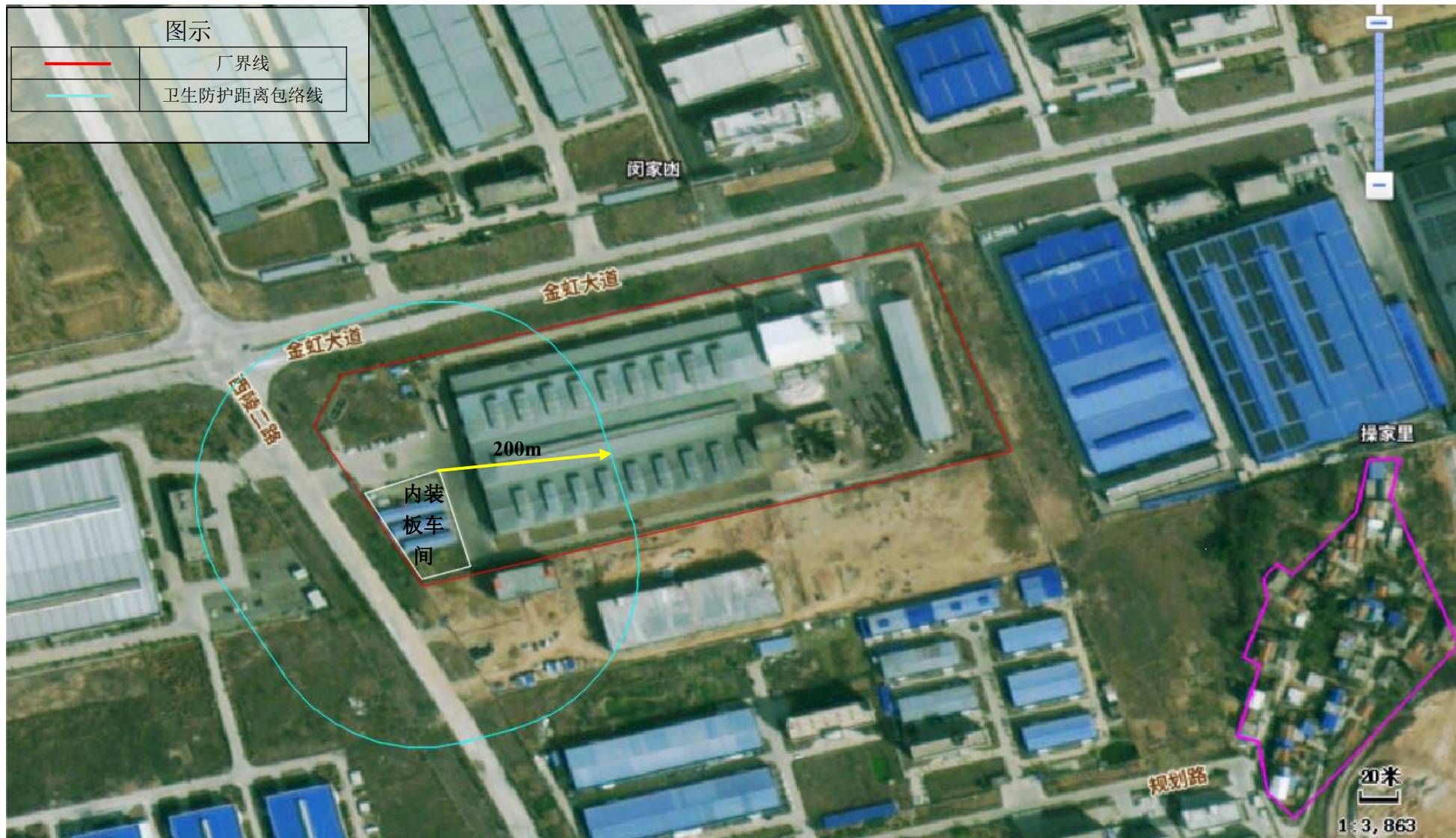
附图 7 卫生防护距离包络线图