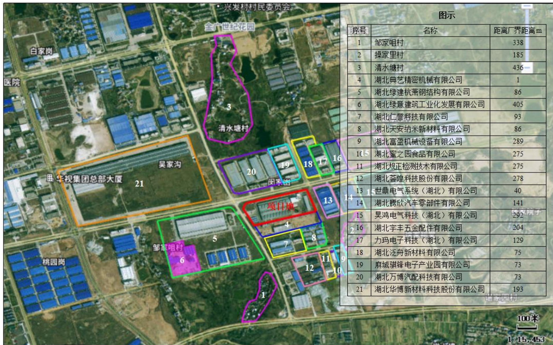
附图2 项目周边关系图