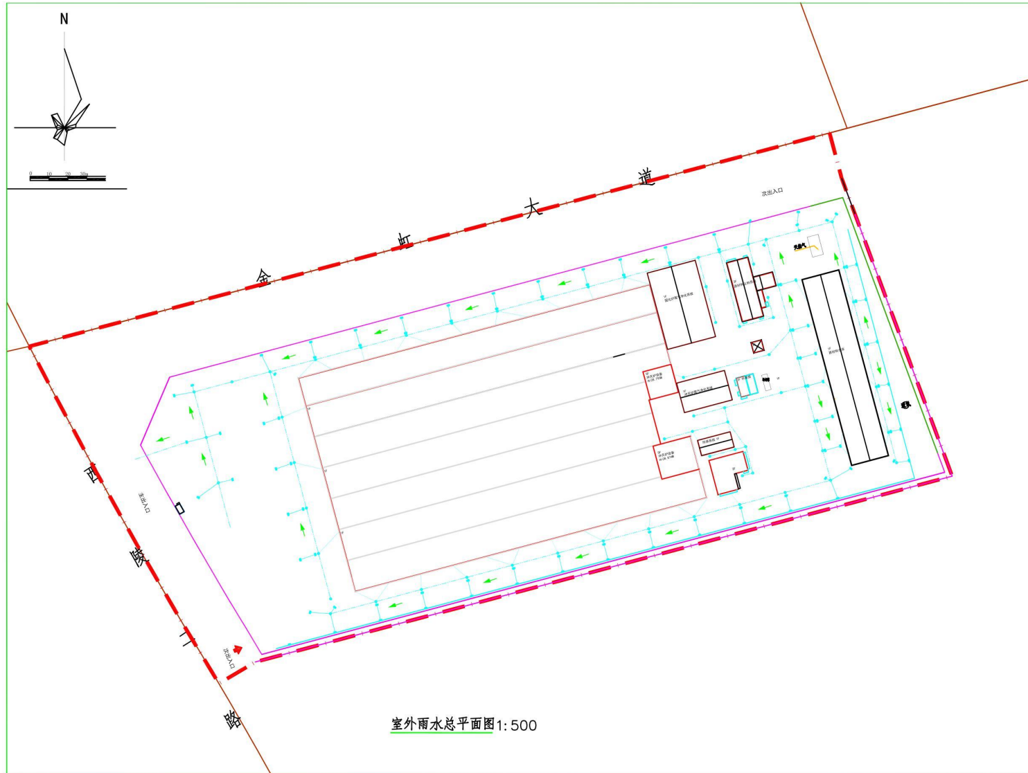
附图 5 雨水管网图