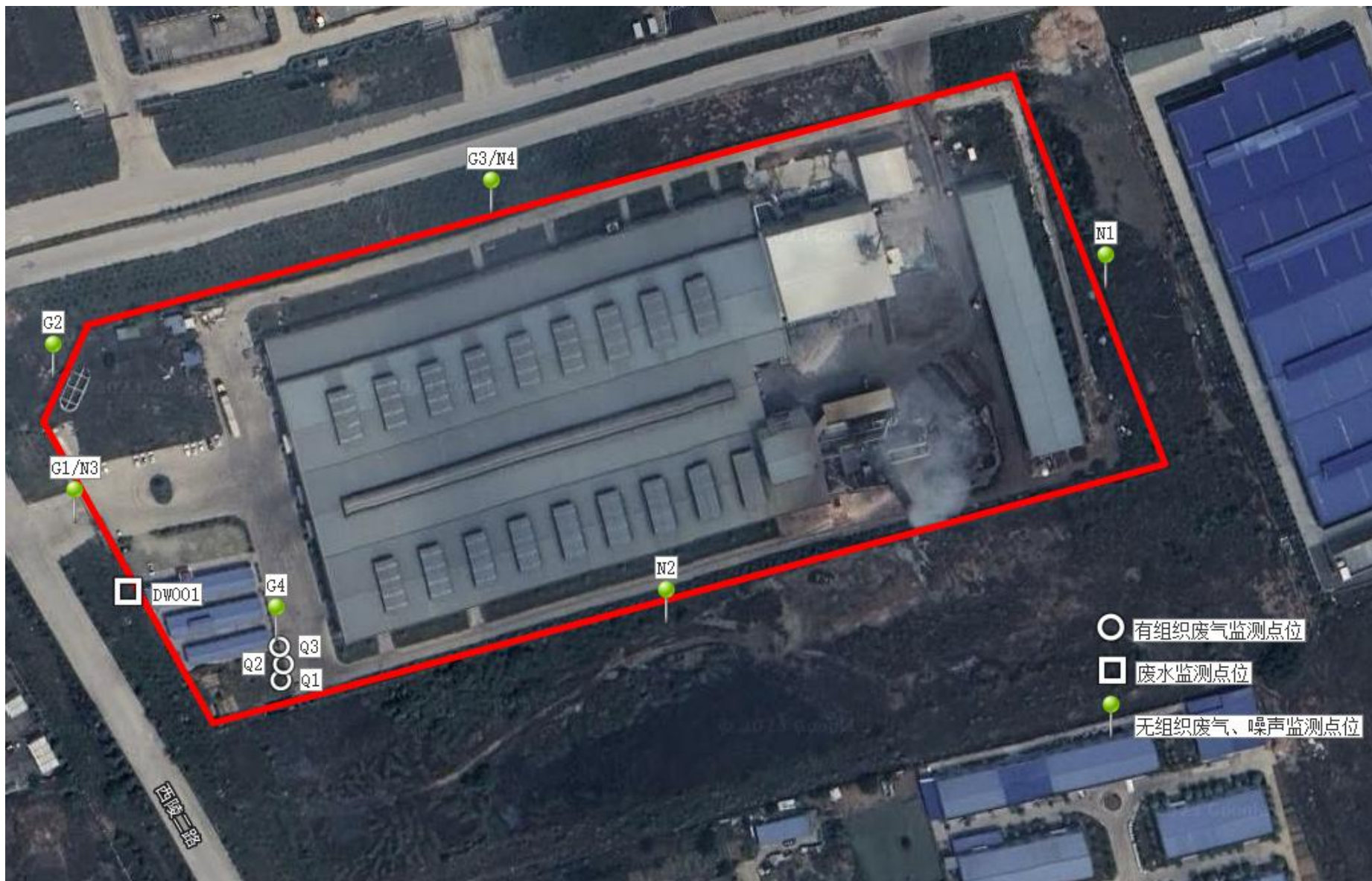
附图3 200万平方米装配式保温装饰板项目阶段性验收监测点位图