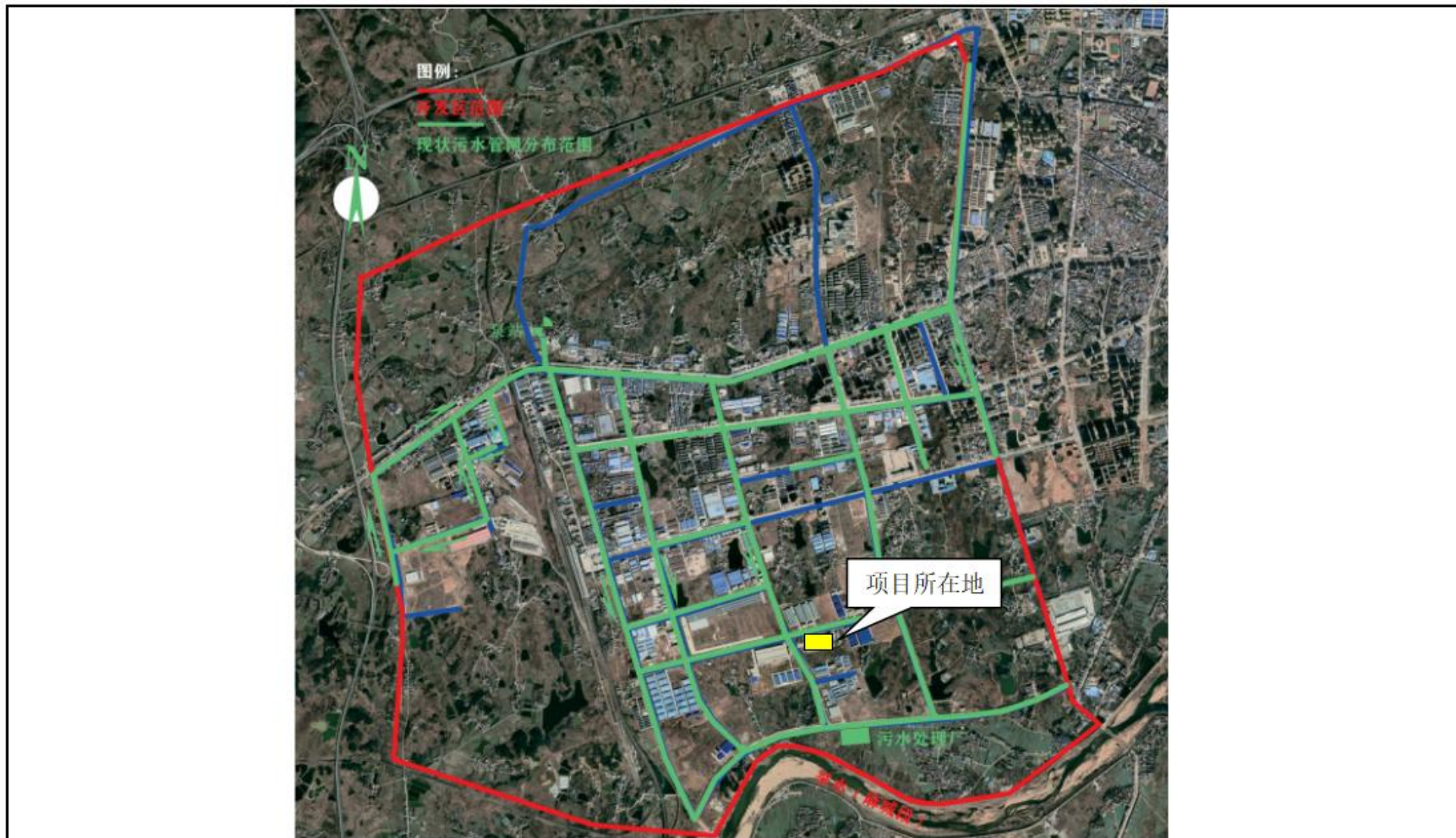
附图 8 麻城经济开发区（2020 年）现状污水管网分布图