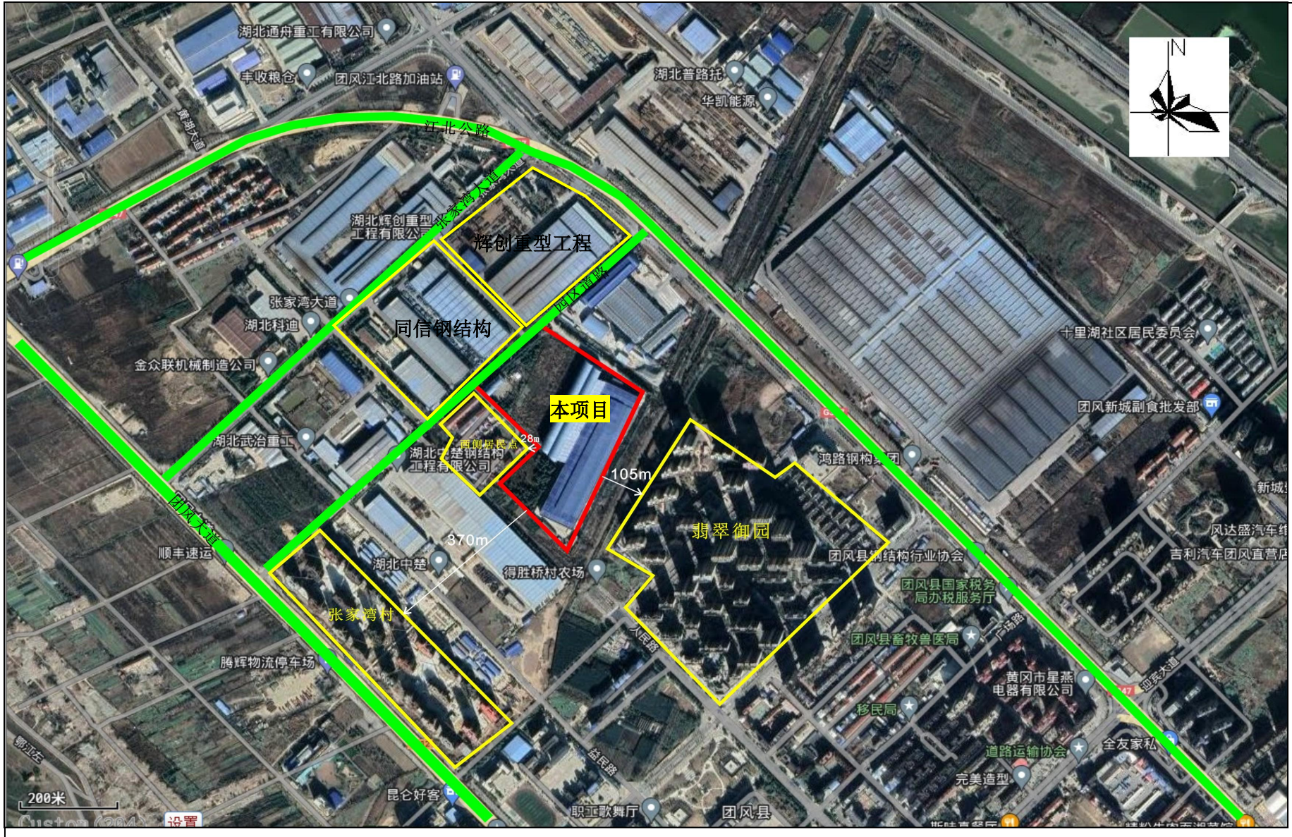
附图2 项目周边关系示意图