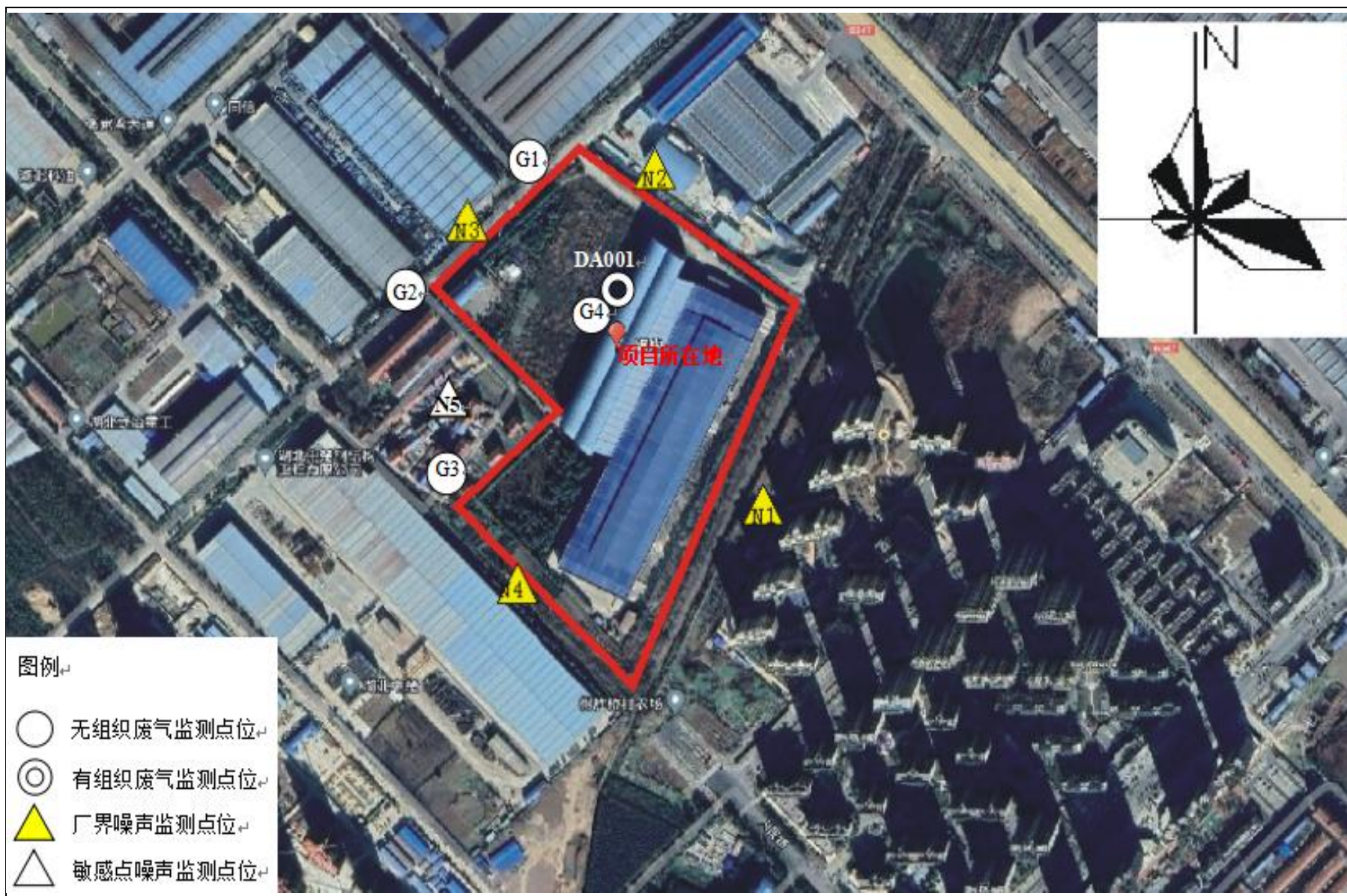
附图 4 项目监测点位图