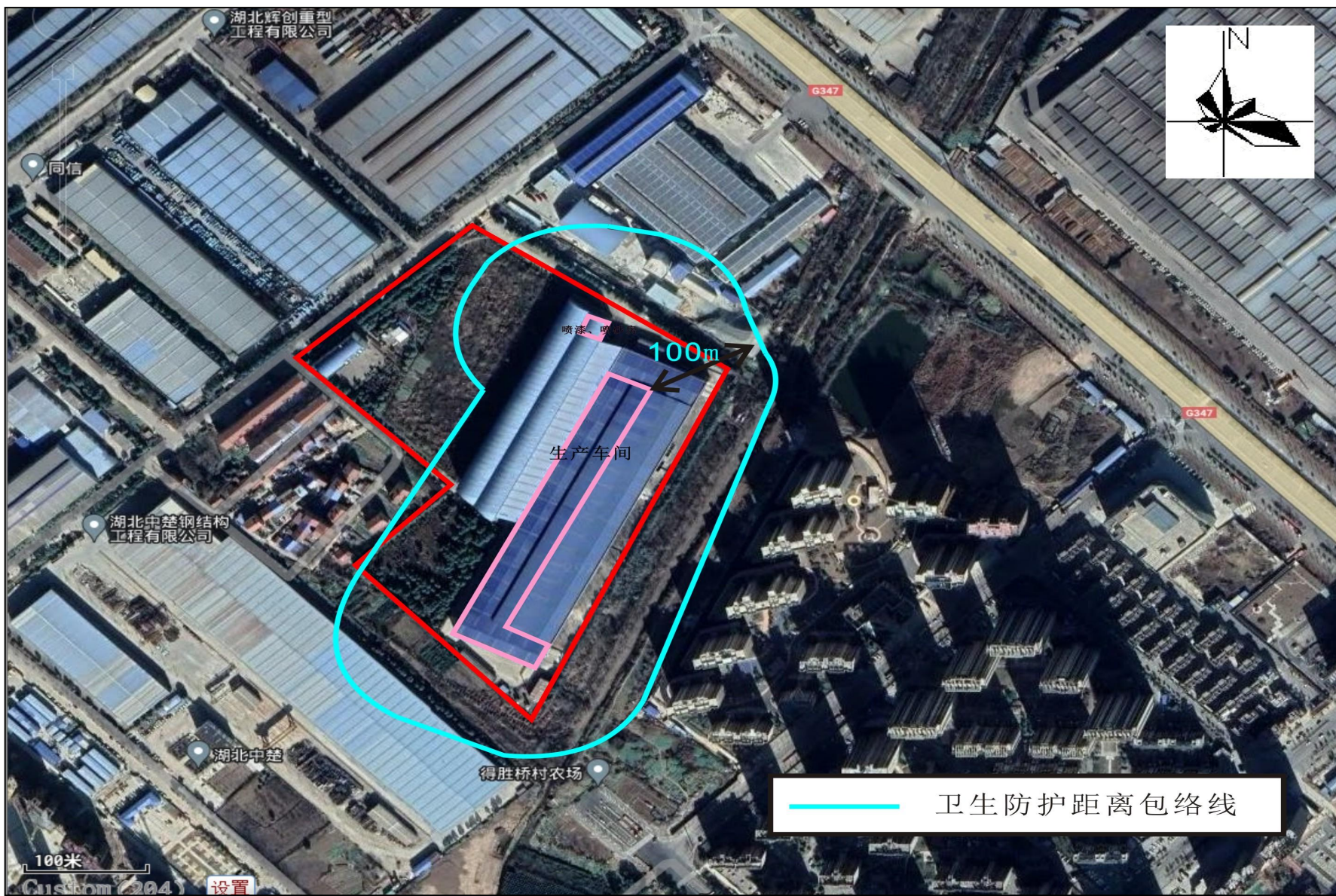
附图5 项目卫生防护距离包络线图